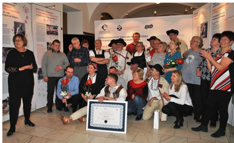
Divadlo SĽUK, Bratislava-Rusovce, 24. január 2019