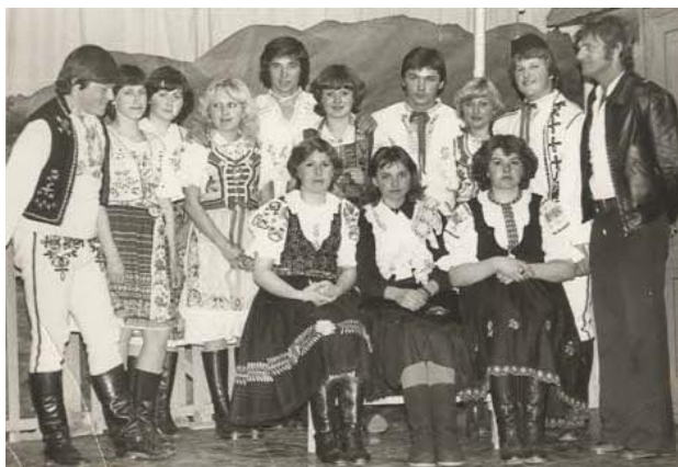
Divadelníci z Praznova v hre Máje , 1980