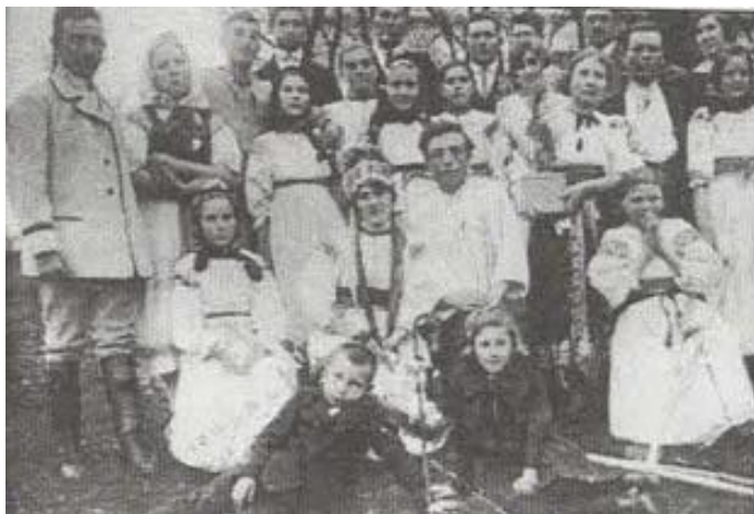
Pružinski ochotníci v hre Rozmajrín , okolo roku 1885 (Zdroj: Pružina (1272-1997): História a súčasnosť , 1997, s. 60)