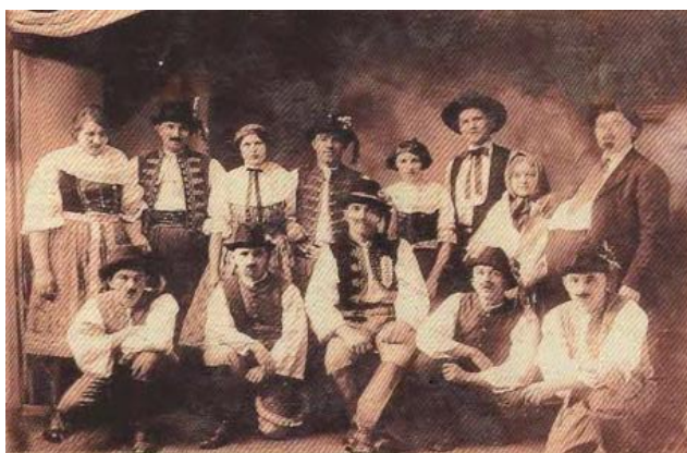
Divadelný krúžok z Domaníže, 1919