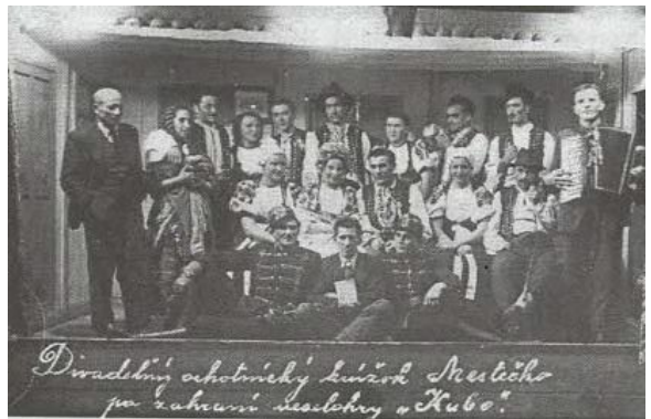
Divadelný ochotnícky krúžok z Mestečka po zahranií hry Kubo