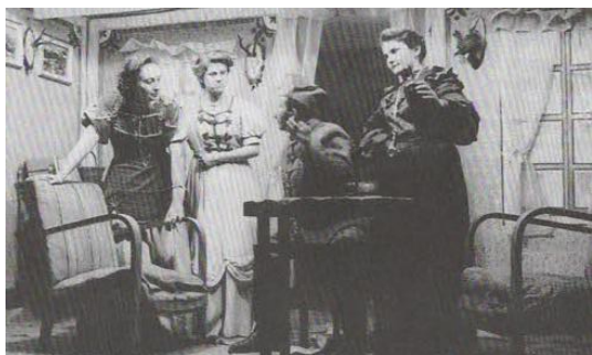
Ochotníci zo Záriačia v hre J. Pálarika - Dobrodružstvo pri obžinkoch (Zdroj: Záriačie , 1998, s. 79)