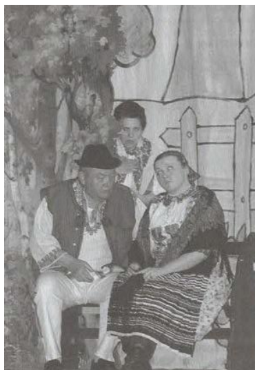
Ilavské ochotnícke divadlo Pod vežou