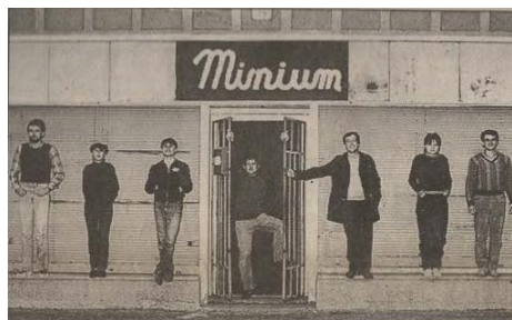
Divadlo malých javiskových foriem MINIUM z Novej Dubnice (Zdroj: Obzor . Roč. 5 (28), č. 3, (17.01.1995), s. 4)