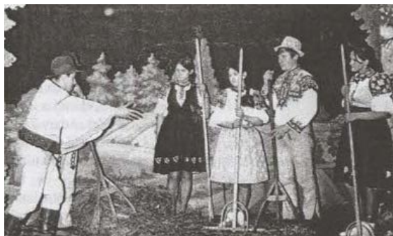
Divadelná hra Stráža spod hája v podaní ochotníkov z Hornej Poruby (Zdroj: Horná Poruba , 2000, s. 48)