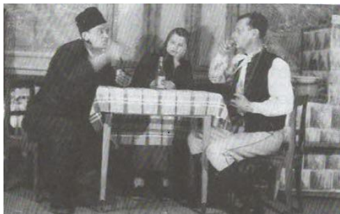
Ochotníctvo v Mikušovciach (Zdroj: Mikušovce , 20019, s. 34)