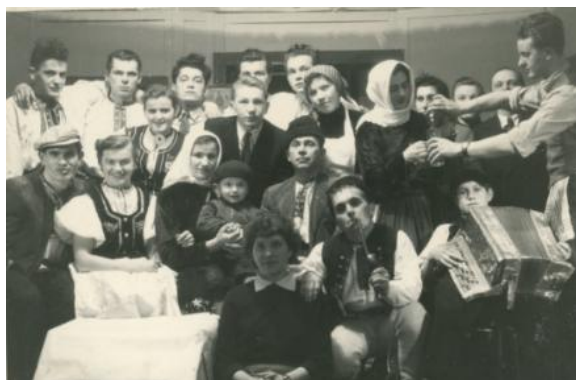
Ochotníci z Dolnej Marikovej v hre „ Mariša “ v roku 1956