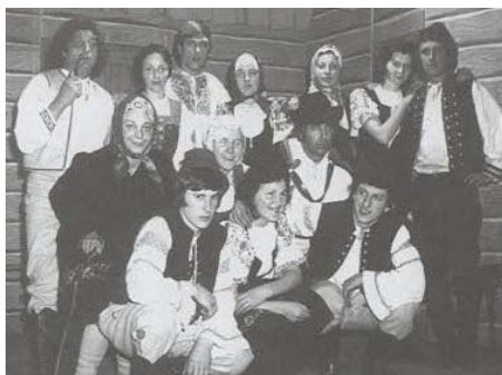
Divadelníci zo Zubáku v roku 1935